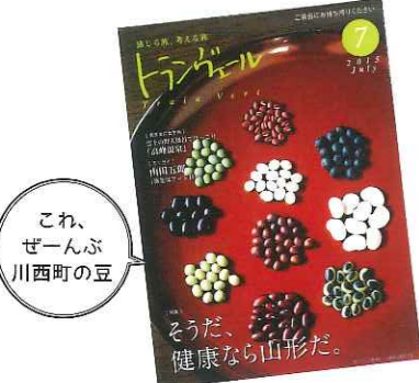
これ、 ぜんぶ 川西町の豆