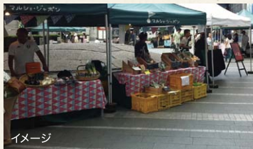
イメージ 台東館5FでOPENします!!