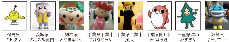
福島県 キビタン 茨城県 ハッスル黄門 栃木県 とちまるくん 千葉県千葉市 ちはなちゃん 千葉県千葉市 風太 千葉県鴨川市 たいよう君 三重県津市 みずぎん 滋賀県 キャップイー

※当日の事情により参加できないご当地キャラクターが出る場合がございます。あらかじめご了承ください。